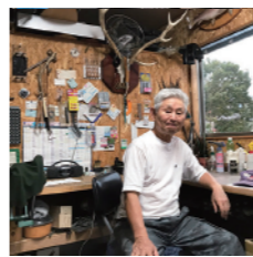
4丁目大沼さん 電動工具、雑貨(釣竿、 ルアー、葉きょう等)

引き換え時間 11時から自治会ブースにて ※当日はフィオーレの方というのわかる 身分証明をお持ちください(郵便物可)