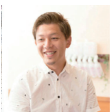
hair work y's Y&Y 青空ヘアワーク (カット・ヘアメイク)