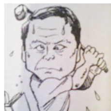
フィオーレゴルフ愛好会 ゴルフ関連&その他