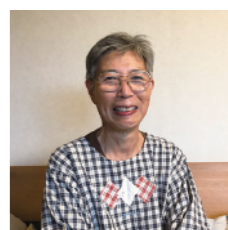
あかね会 食べてよし赤飯と キノコご飯