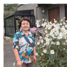
フィオーレ押し花教室 押し花作品展示、 押し花ハガキの販売