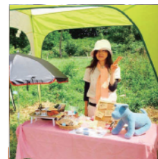
わんちゃんとナチュラルizm 手作りのわんちゃん おやつとデリ