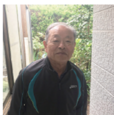
フィオーレ九条の会 原爆資料展示、署名、 小物販売など