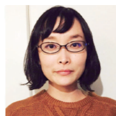
Opus caprice アクセサリ販売 & レジンのワークショップ