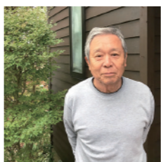
和会 輪投げゲーム