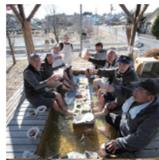
フィオーレ足湯の会 ヤキトリ、缶ビール