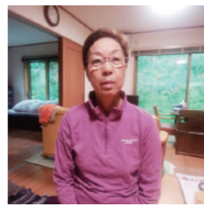
1丁目 廣瀬さん ギフト用の食器や古 着など